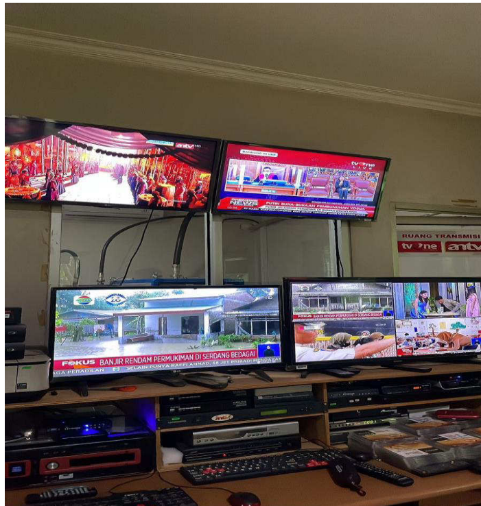
Gambar 2: Studio Produksi TV One Ambon