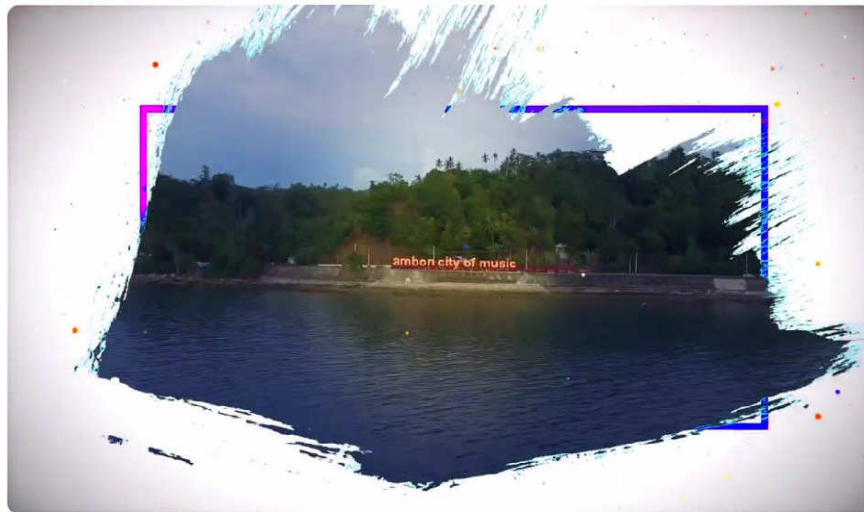
Gambar 5: Program Siaran Beta Maluku di Indosiar

Sebagaimana diuraikan sebelumnya, masing-masing Lembaga Penyiaran memiliki program siaran unggulan yang isi kontennya bermuatan ragam potret peristiwa daerah. Di Indosiar Ambon, terdapat program Beta Maluku yang fokus menggarap ragam corak khas daerah Maluku, seperti budaya pela-gandong, ragam tarian adat, kebiasaan hidup komunitas kepulauan, hingga kawasan unggul pariwisata. Ragam potret tersebut dikemas dalam satu program siaran, dan disebar dalam beberapa episode yang berbeda. Dengan model penyajian serta muatan konten yang dianggap berkualitas, oleh Komisi Penyiaran Indonesia, program siaran Beta Maluku yang disiarkan di Indosiar pernah dianugerahkan sebagai Program Siaran Lokal terbaik di Indonesia, pada 2022 yang lalu. Selain Indosiar, NET TV Ambon juga terkategori sebagai Lembaga Penyiaran yang memiliki fokus garapan tema seputar kebudayaan dan pariwisata yang disiarkan pada Program Indonesia Bagus. Berbeda dengan program Beta Maluku, program Indonesia Bagus disiarkan secara nasional dan sekaligus menjadi momentum untuk mempromosikan ragam keunggulan spasial yang ada di Maluku.