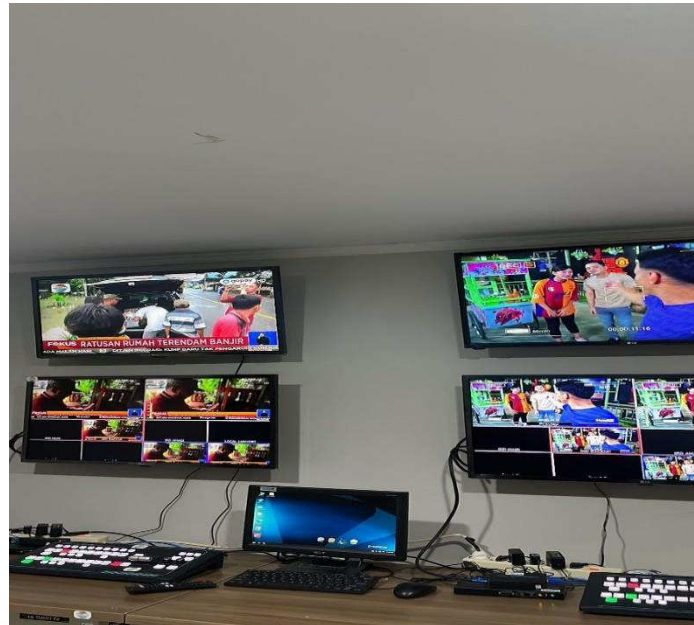
Gambar 3: Studio SCTV dan Indosiar Ambon