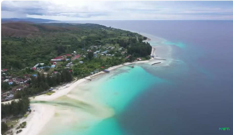
Gambar 6: Program Siaran Indonesia Bagus NET TV dengan judul Tanah Surga di Pulau Buru

Di lain sisi, Kompas TV Ambon fokus dalam menggarap ragam peristiwa lokal yang dikemas menjadi news /berita lokal, dan selanjutnya disiarkan sebagai preferensi informasi publik. Sebagaimana diuraikan sebelumnya, Kompas TV menggunakan tenaga kontributor yang bertugas dalam mencari sekaligus menghimpun informasi daerah, yang selanjutnya akan diubah menjadi berita. Program news Kompas TV terbilang cukup membantu Masyarakat, terkhususnya stakeholders seperti pemerintah daerah, yang berkepentingan agar informasi daerah tersebar secara merata.