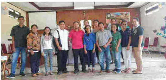
Gambar 2.6 Selesai Kegiatan Pembukaan PkM

Kegiatan Pembukaan Pengabdian kepada Masyarakat ditutup dengan sesi foto bersama Tim PkM dan KMJ serta Perangkat Pelayan yang hadir dalam kegiatan Pembukaan Kegiatan PkM.