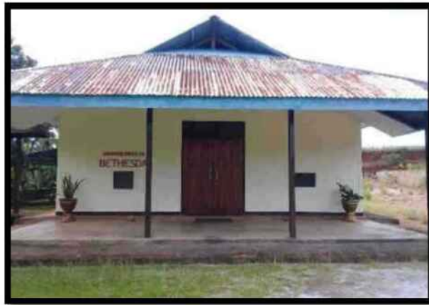
Gambar 1.1 Gedung Gereja Bethesda Jemaat GPM Kayeli

Jemaat GPM Kayeli merupakan jemaat diaspora dari pulau Buru akibat konflik kemanusiaan yang terjadi di Maluku pada tahun 1999. Jemaat ini berlokasi pada dua wilayah tempat tinggal, wilayah yang satu berada di negeri Amahusu dan yang satunya lagi di negeri Airlow. Jumlah anggota jemaat Kayeli saat ini ada 68 kepala keluarga, yang terbagi atas 3 unit, memiliki 9 orang majelis (1 KMJ, 4 penatua dan 4 diaken), unit 1 (4 orang majelis) unit 2 (2 orang majelis) unit 3 (2 orang majelis), 18 koordinator unit (1 unit terdiri dari 6 orang), 22 orang pengasuh (guru SMTPI) dan 15 orang pengurus AMGPM.