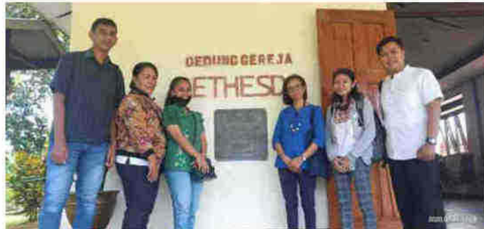
Gambar 2.1 TIM PkM Prodi Teologi IAKN Ambon