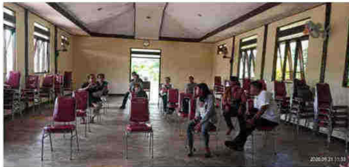
Gambar 2.5 Diskusi singkat Perangkat Pelayan dengan TIM

anggota jemaatnya dapat mengikuti kegiatan dimaksud dengan baik.