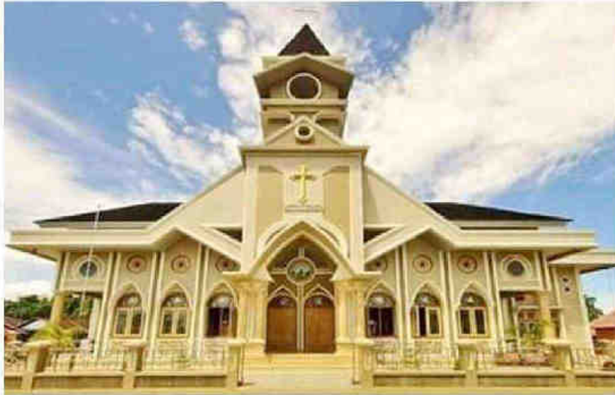
Gambar 1. Gedung Gereja Jemaat Hulaliu

melainkan kepada tugas-tugas pembinaannya yang tertuju kepada dunia ini (Ismail, 1998).