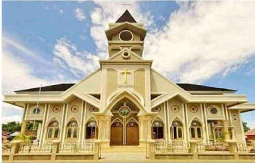
Gambar 1. Gedung Gereja Jemaat Hulaliu

melainkan kepada tugas-tugas pembinaannya yang tertuju kepada dunia ini (Ismail, 1998).