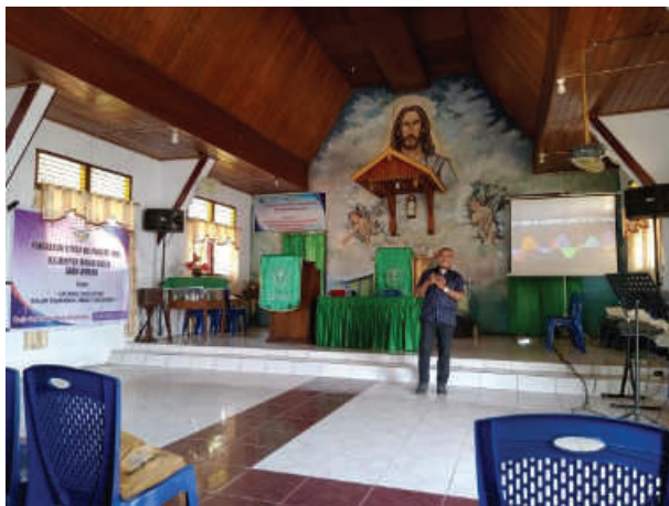
Gambar 2.3 Penyampaian Materi Layanan Konseling Pastoral