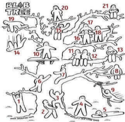
Gambar 2.1 Blob Tree