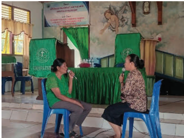
Gambar 2.6 Peserta Perempuan mempraktekkan LayananKonseling Pastoral (Sumber: Dokumentasi , 08 November 2023)