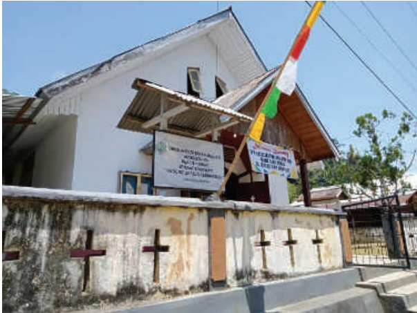
Gambar 1.1 Gedung Gereja Eben-Haezer (Sumber: Dokumentasi , 08 November 2023)

Berbicara tentang penguatan kapasitas masyarakat Sokowati dalam era globalisasi membutuhkan observasi awal untuk dapat memetakan bentuk penguatan kapasitas yang dilakukan sesuai kondisi dan kebutuhan masyarakat Kristen Sokowati.