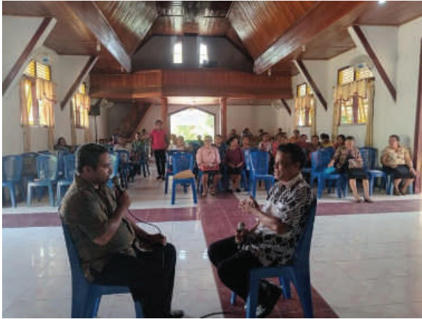
Gambar 2.5 Peserta Laki-Laki mempraktekkan LayananKonseling Pastoral