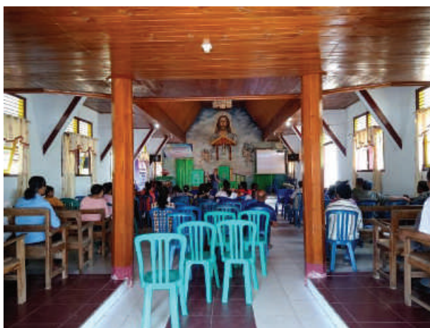
Gambar 2.4 Pemateri dan Peserta Layanan Konseling Pastoral (Sumber: Dokumentasi, 08 November 2023)